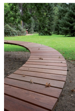
Solution de base en bois