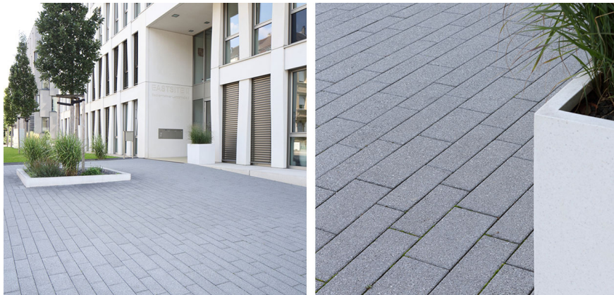
Pavage béton type Baretto société Kronimus formats mélangés