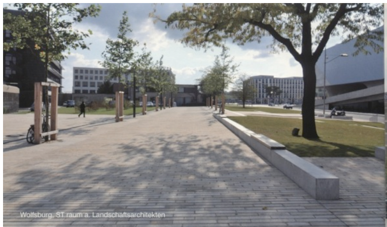
Ou pavage naturel type granit format idem produit béton (Granit Graniterie Petitjean et Société Besco )