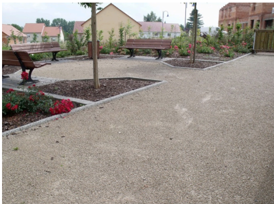
sablé renforcé type 'Sand Process'