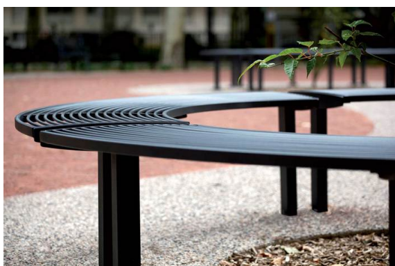
banc concave type véra solo de sté MMCité (variante en métal)