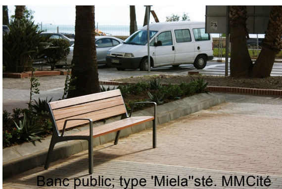
Banc public; type 'Miela"sté. MMCité