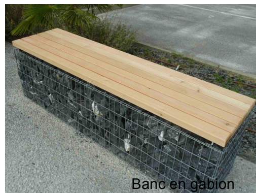
Banc en gablon