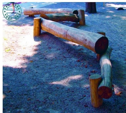
Poutre d'équilibre en bois exemple: ste Pro urba