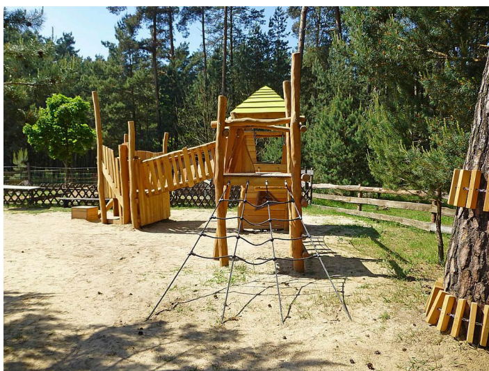
Type de structure de jeux base en Robinier variante en pin exemple Société Eibe gamme Paradiso