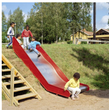
Toboggan de talus en Inox Hauteur de chute 1,45 m environ. exemple Sté Hags