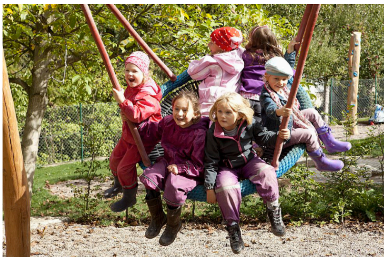
Balançoire type nid d'oiseau Jeux en robinier Société Eibe